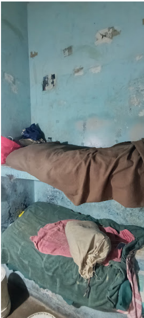
Alcaidía UR II General Pico, Pabellón 1