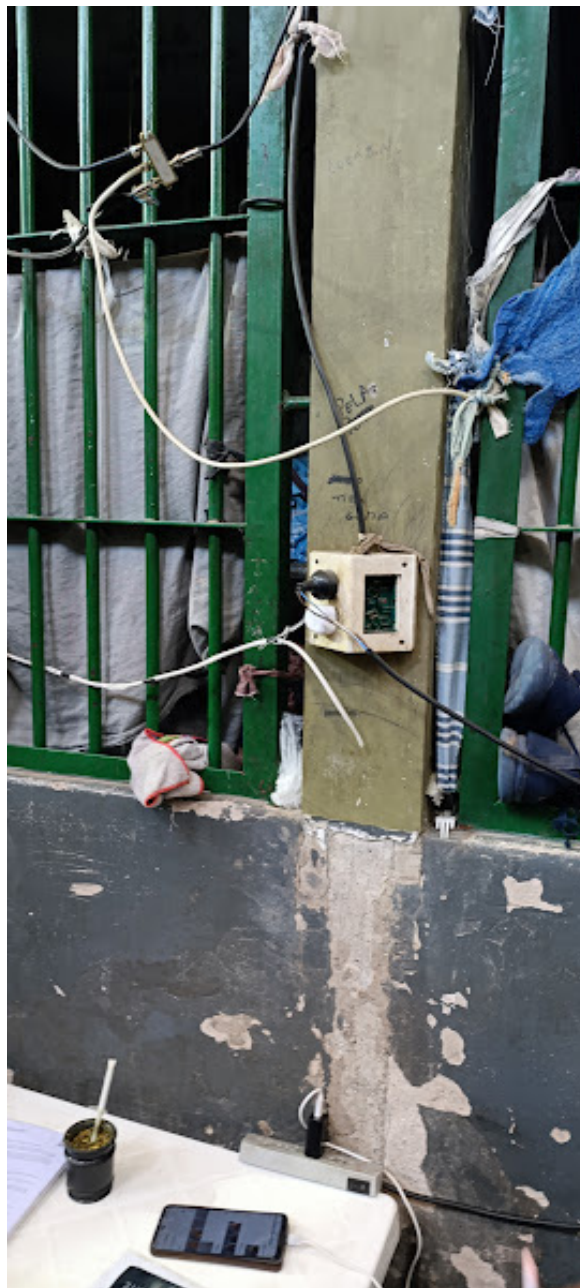
Alcaidía UR I de Santa Rosa, Pabellón Ala Este

2. Resulta especialmente grave la situación de las personas alojadas en el sector Contención de la Alcaidía UR I de Santa Rosa, donde en una celda de 6 m 2 de superficie se alojaban tres personas.