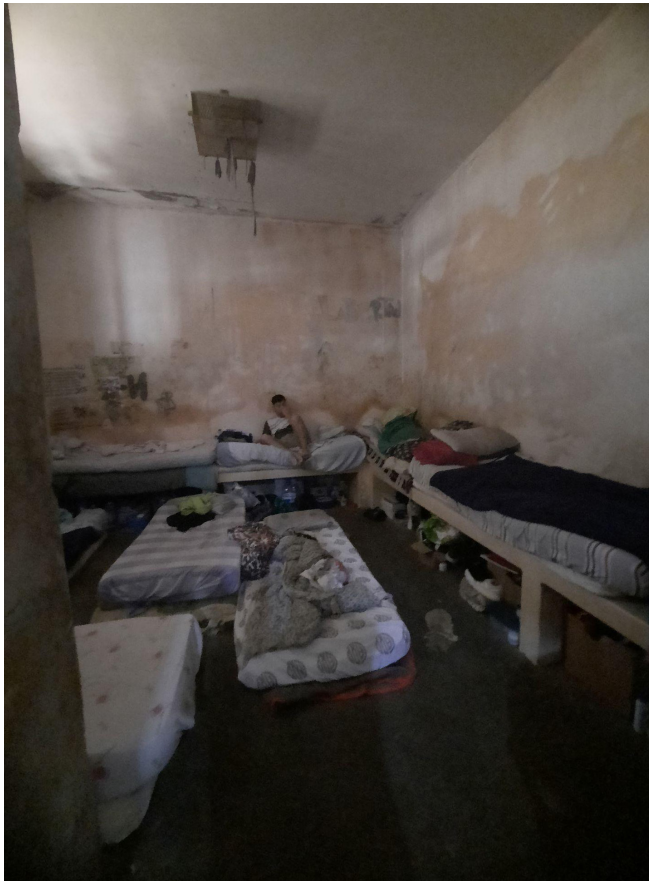
Comisaría 2 de Santa Rosa