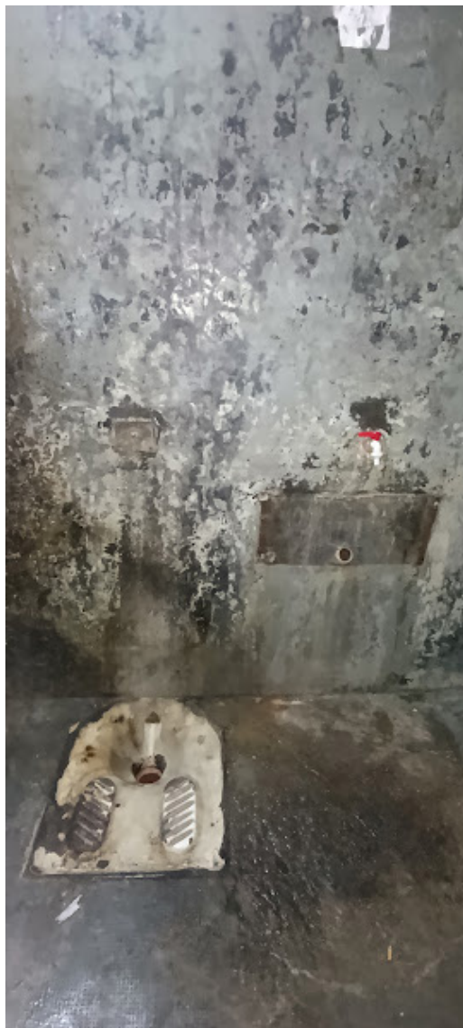
Celda de Contención Este Alcaidía UR I de Santa Rosa

3. Por su parte, en comisarías se relevaron situaciones más graves, con 7 m 2 de área en una celda que alojaba a tres personas, con una cama y dos colchones en el piso, que tampoco cumple con los estándares citados 32 .