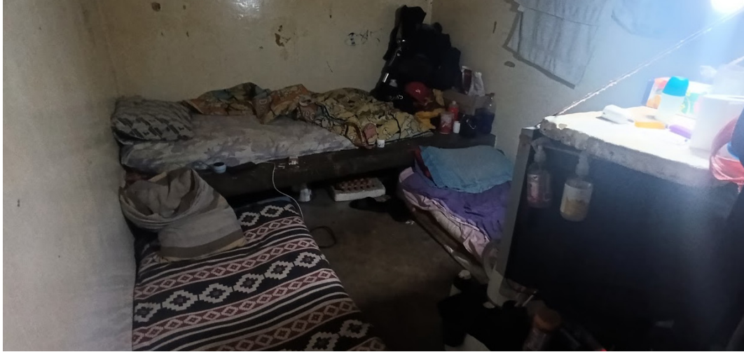
Comisaría 2 de General Pico