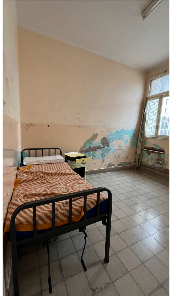
Hospital Lucio Molas